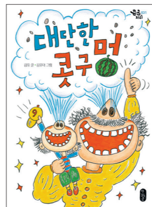
★아빠와 나, 가족애