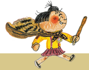
고개를 넘고 난 뒤