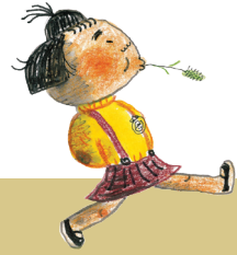
고개를 넘기 전