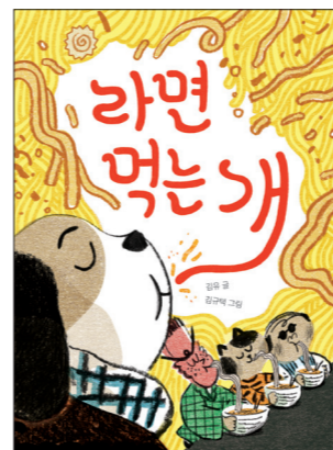
★요리, 위로, 나눔, 친구

통합(여름) 2-1-1 이런 집 저런 집 국어 3-1-10 문학의 향기 도덕 3-1-3 사랑이 가득한 우리 집